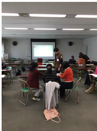
ワークショップ型研修の実施