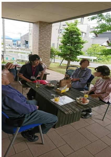
地域のコミュニティ開催