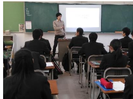
高校生向けの職業講話